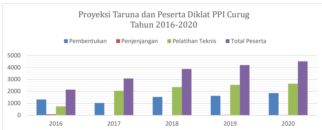
Grafik. 2.1. Proyeksi Taruna dan Peserta Diklat PPI Curug

diproyeksikan akan mengalami kenaikan sekitar rata-rata 21%, walaupun pada layanan diklat penjenjangan pada tahun 2017 dan 2018 tidak terselenggara dikarenakan PPI Curug mengurangi pelaksanaan kegiatan diklat penjenjangan. Diklat penjenjangan untuk saat ini masih belum banyak peminat, sehingga diproyeksikan menurun. Hal ini dapat disiasati bila PPI Curug membuka program baru untuk pelaksanaan Pasca Sarjana yang akan dikembangkan selanjutnya.